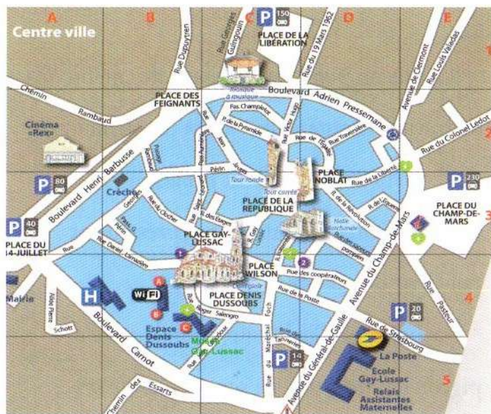
© SAUDEVARD et mairie de Saint-Léonard de Noblat

Renseignements pratiques : Accès : 1 rue Jean Giraudoux